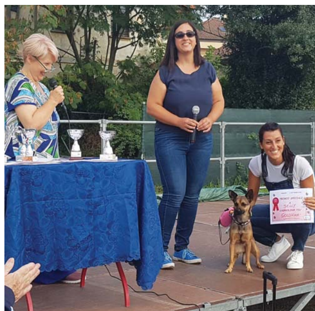
Nelle fotografie: l'asino Olmo e la premiazione del concorso canino