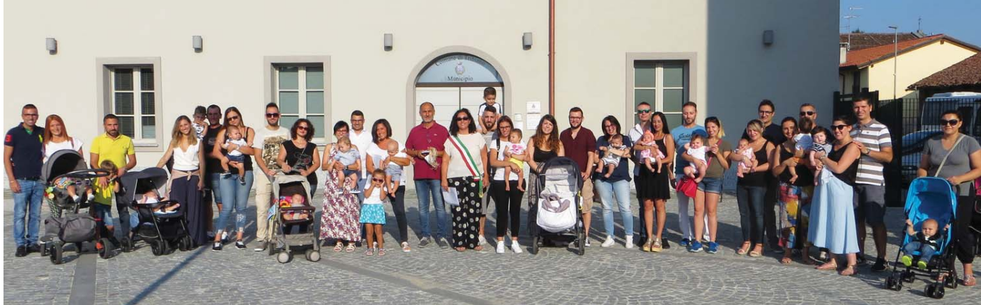
Papà, mamme e figli neonati presenti all'iniziativa "Cresciamo Insieme"