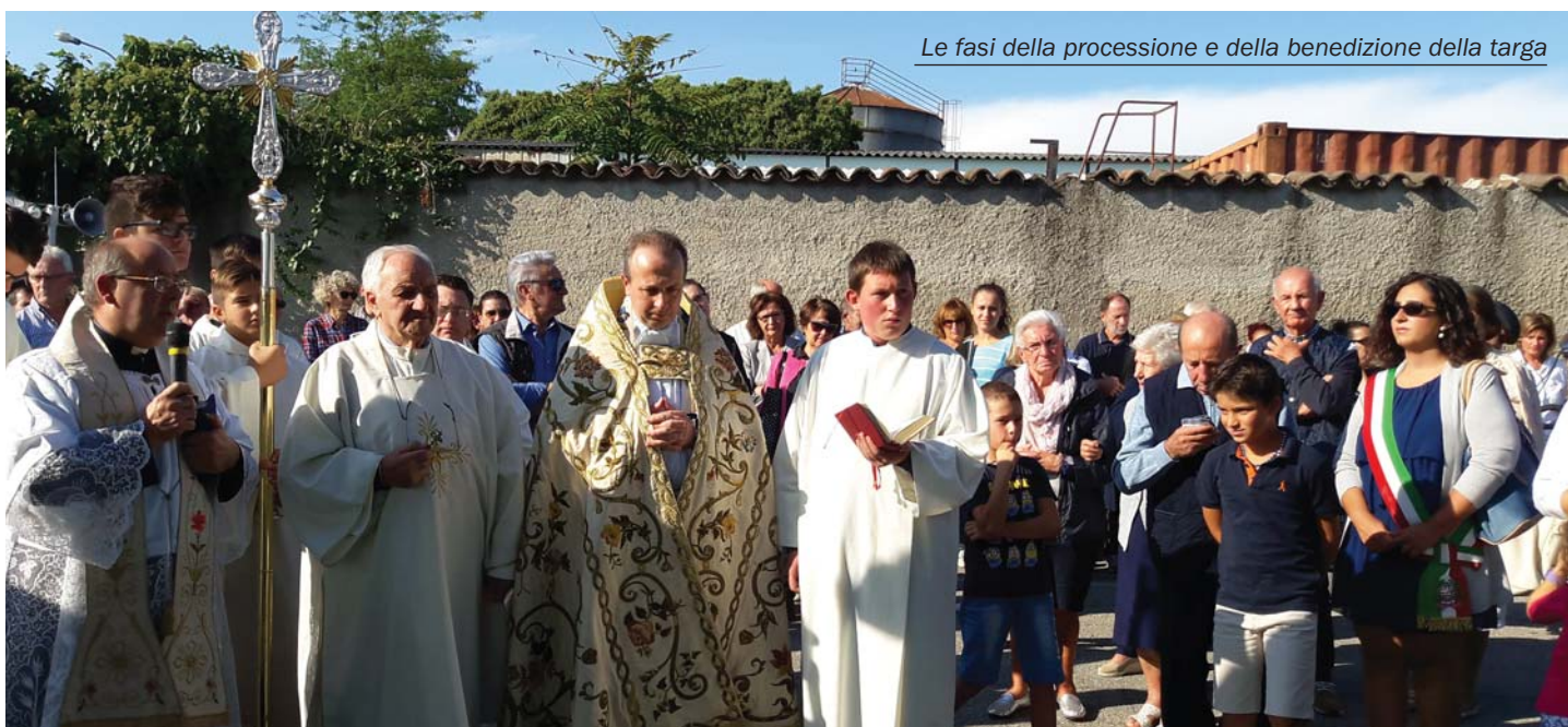
Le fasi della processione e della benedizione della targa