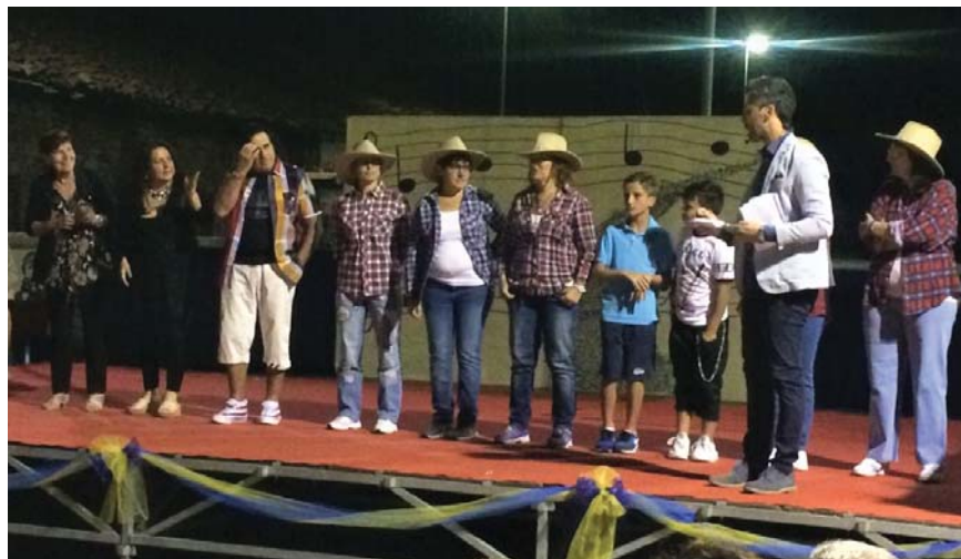
Il palco su cui si sono misurati i concorrenti della Corrida

Come nel format del grande Corrado Mantoni, i concorrenti hanno dato prova delle loro abilità misurandosi in ballo, canto e barzellette