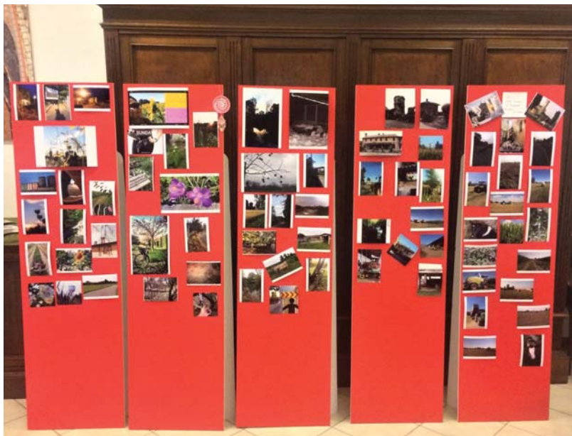
La mostra fotografica