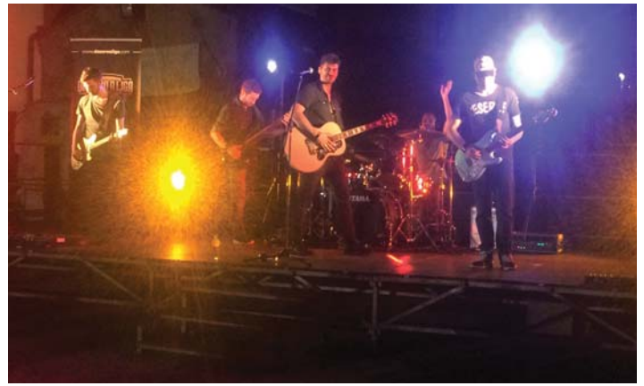
La performance live della band